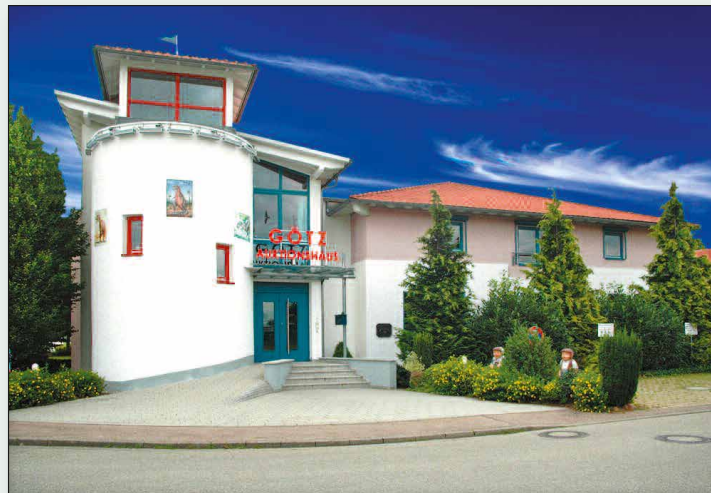
Das Firmengebäude in Oberkirch.